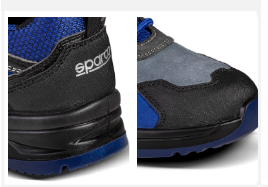
RINFORZO ANTIABRASIONE in microfibra su punta e tallone.