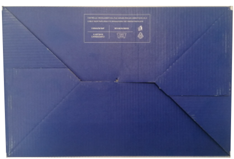
SCATOLA SCARPE SPARCO TEAMWORK in cartone blu-bianco-arancio e carta velina interna protettiva. Dimensioni 343x188x123 mm Indicazioni per il riciclo valide per l'ITALIA sul fondo (PAP20)