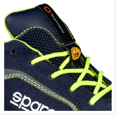
NASTRINO TEAMWORK cucito sulla linguetta (15x60 mm) e ETICHETTA ESD stampata su passalacci