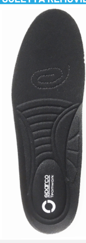
SOLETTA REMOVIBILE antistatica in morbido poliuretano con termoformatura ergonomica.