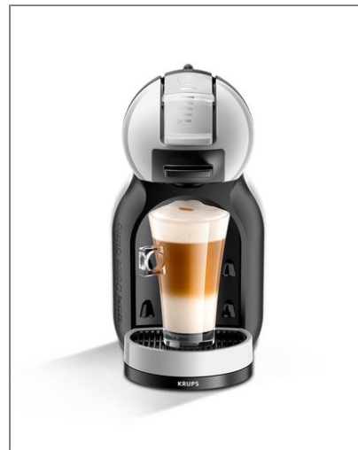
MINI ME GRIS ANTRACITA Cafetera de cápsulas multibebida KP123B10