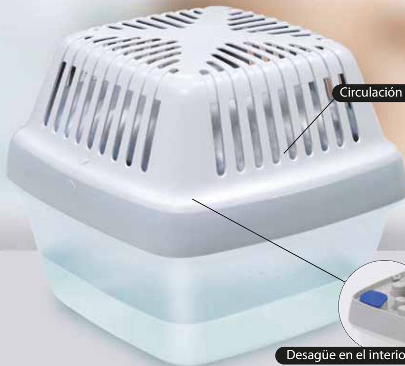
Circulación de aire mejorada

NUEVO ANTIHUMEDAD CON DISEÑO OPTIMIZADO POR GIUGIARO DESIGN