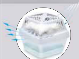
Antiderrame con máxima aireación