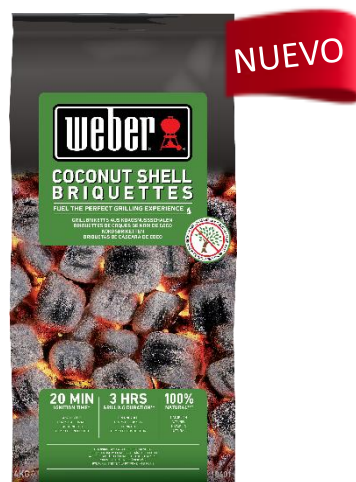
2 kg MAD Feb. 2023