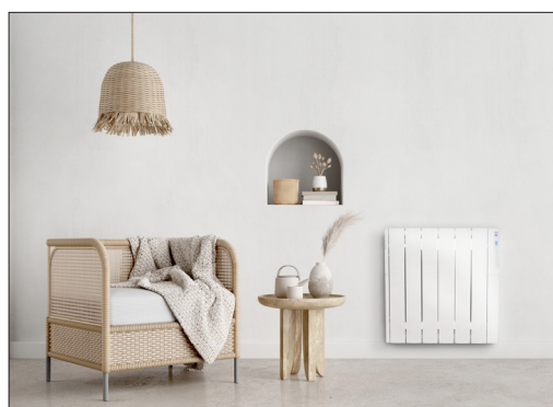
Detalle APP | Detalle USB (No incluido) | Escena ZW1000