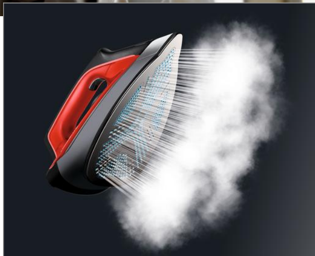
PERFECT STEAM PRO Centro de planchado DG8642F0