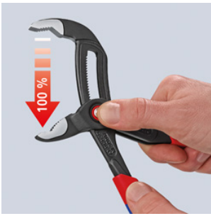
Pulsar botón – abrir la tenaza completamente