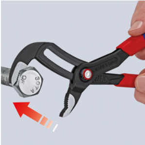
Colocar la mordaza de agarre – cerrar simplemente las tenazas