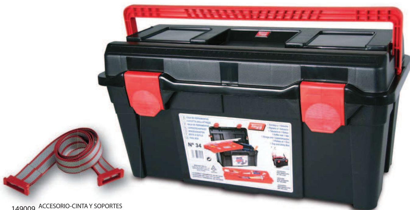
149009 ACCESORIO-CINTA Y SOPORTES ACCESSORY-STRAP, FRAME