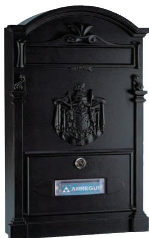
Negro/ E-2644 * 126448