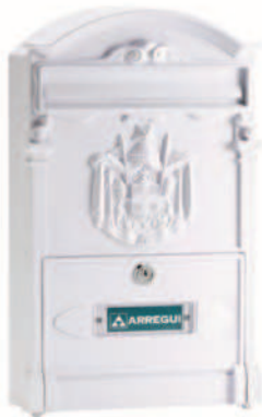
Blanco/ E-2611 * 126110