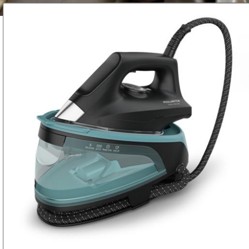
Force Pro 250 de Rowenta, centro de planchado, bomba de 6 bares, golpe de vapor de 320 g/min, azul y negro Centro de planchado VR4210F0